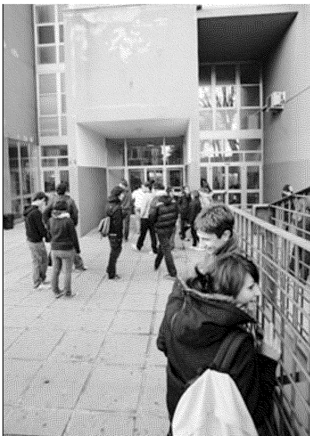
A sinistra un gruppo di studenti fuori dal liceo Dante in via Giustiniano, a fianco il ministro dell'Istruzione Maria Stella Gelmini

● L'ultimo passaggio prima dell'entrata a regime della riforma sarà il vaglio della legittimità dei risvolti economico-finanziari dell'operazione