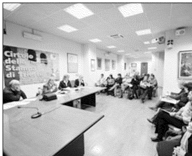
L'incontro del Pd su scuola e immigrati

Tra le perplessità espresse dalla Estori, un altro problema: «Sono i genitori italiani a spostare i propri figli in altre scuole perché non vogliono che frequentino classi miste. In questo caso noi ci troviamo ad affrontare un aumento degli alunni stranieri, ma anche un calo di iscritti che comporta a sua volta un calo di risorse. Non è solo il tetto del 30% a creare fenomeni discriminatori ma tutta la situazione». (i.g.)