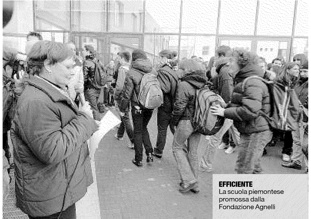
EFFICIENTE La scuola piemontese promossa dalla Fondazione Agnelli

Alta, rispetto alle altre regioni, la spesa per studente: 7.000 euro. Tanti docenti di sostegno