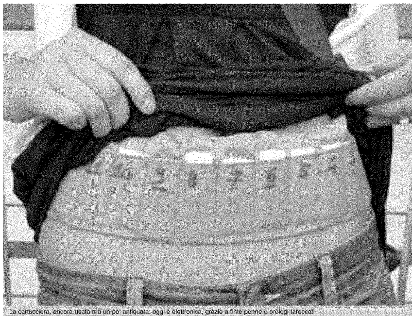
La cartucciera, ancora usata ma un po' antiquata; oggi è elettronica, grazie a finte penne o orologi taroccali