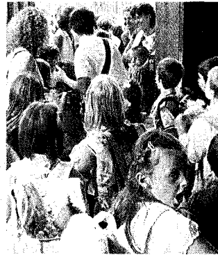
Primo giorno alle elementari

Nelle scuole primarie statali i docenti per il prossimo anno scolastico saranno 3.244. Rispetto all'anno scorso ci sarà qualche classe in meno anche il numero degli allievi risulta in leggero aumento. Finora gli iscritti alle scuole primarie statali per il ciclo 2010-2011 sono 41.209 e saranno suddivisi in 2.119 classi, di cui 378, vale a dire circa il 18 per cento, saranno a tempo pieno. Nelle scuole primarie, come del resto in quelle dell'infanzia,