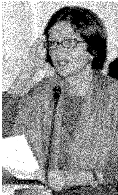
Il ministro dell'istruzione Maria Stella Gelmini